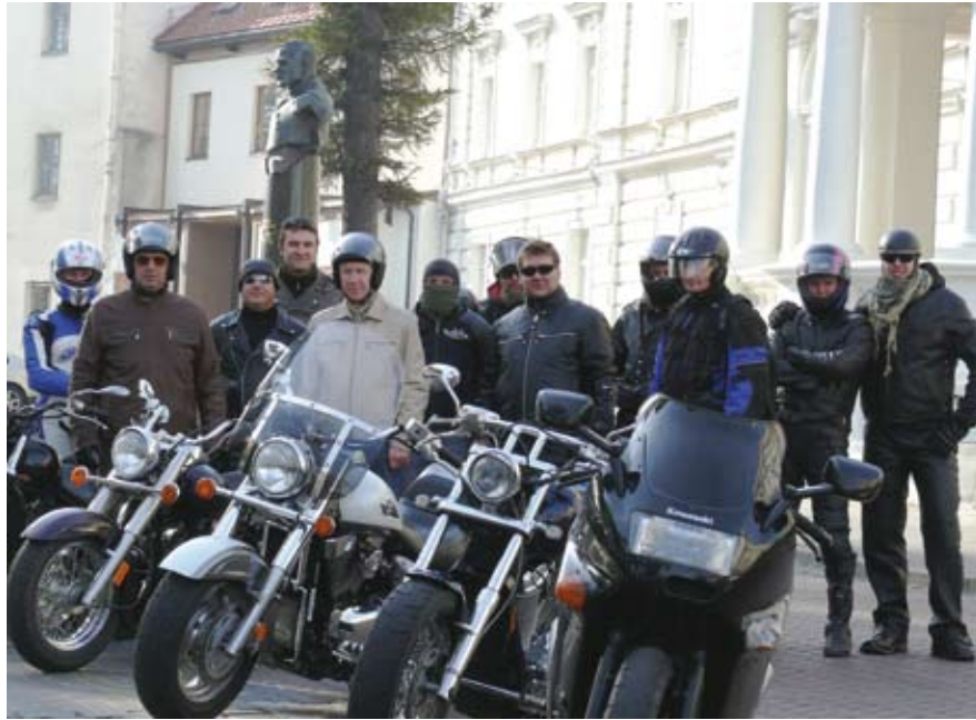
Vyrai pasirenkę plieno žirgus balnoti...