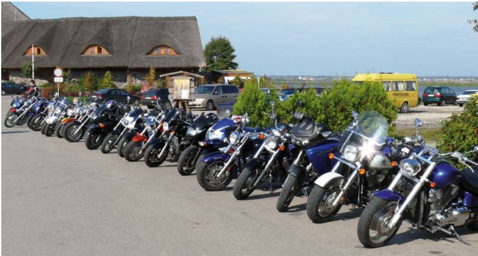
Elito vyrų rinktiniai motociklai.

– Mūsų motociklai labai įvairūs. Kalbant bai-